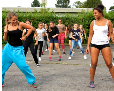
Tanzen macht Spass - Mädchenpowerstag 2016

Aber auch während den regulären Trefföffnungszeiten fertigten einige Jugendliche Masken aus Gips, malten sich gegenseitig an – oder dekorierten das Joy fasnächtlich.