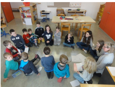
Austausch in der altersdurchmischten Gruppe

Alle Vorschläge der Kinder hängen im Schulhausgang und können noch bis Ende der Fasnachtsferien besichtigt werden. Danach ziehen sich die Lehrpersonen zur Beratung zurück und wählen gemeinsam mit der Bildungskommission ein neues Logo der Schule, welches auf den Ideen der Schülerinnen und Schüler