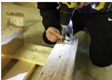
Rollen sorgen für Flexibilität und «Mobilität».

Es ist Dienstag 16.00 Uhr. Das Jugendbüro des Joy hat geöffnet. Ausgehend von den Erfahrungen und der geführten BesucherInnen-Statistik werden in den nächsten zwei Stunden zwischen 15 und 20 Jugendliche erwartet. Einige davon kommen einfach um Hallo zu sagen, zu reden und zu chillen, andere Treffen sich hier mit ihren Freunden und Freundinnen bevor es ins Training oder sonst irgendwohin geht. Doch die meisten kommen, um gemeinsam mit den Jugendarbeitenden anstehende Projekte oder Anlässe zu planen oder gezielte Unterstützung respektive Rat zu jugendspezifischen Themen zu erlangen, wie beispielsweise dem Stress mit einem guten Freund oder der Sorge, keine Lehrstelle zu finden. Der Jugendkommission sowie den Jugendarbeitenden ist es wichtig, neben den normalen Trefföffnungszeiten vom Mittwoch, Donnerstag und Freitag auch gezielt ein Zeitfenster zu bieten, welches sich solchen Themen annimmt. Dieses Zeitfenster, welches sich von den «normalen» Treffzeitfenster