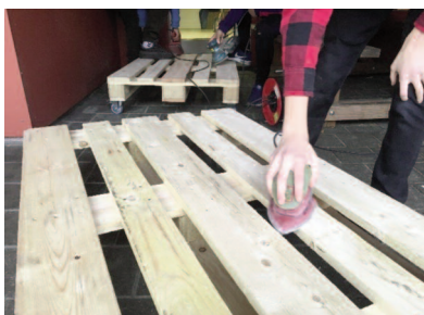
Jugendliche befreien die Paletten von Unebenheiten.

Es ist Dienstag 16.00 Uhr. Das Jugendbüro des Joy hat geöffnet. Ausgehend von den Erfahrungen und der geführten BesucherInnen-Statistik werden in den nächsten zwei Stunden zwischen 15 und 20 Jugendliche erwartet. Einige davon kommen einfach um Hallo zu sagen, zu reden und zu chillen, andere Treffen sich hier mit ihren Freunden und Freundinnen bevor es ins Training oder sonst irgendwohin geht. Doch die meisten kommen, um gemeinsam mit den Jugendarbeitenden anstehende Projekte oder Anlässe zu planen oder gezielte Unterstützung respektive Rat zu jugendspezifischen Themen zu erlangen, wie beispielsweise dem Stress mit einem guten Freund oder der Sorge, keine Lehrstelle zu finden. Der Jugendkommission sowie den Jugendarbeitenden ist es wichtig, neben den normalen Trefföffnungszeiten vom Mittwoch, Donnerstag und Freitag auch gezielt ein Zeitfenster zu bieten, welches sich solchen Themen annimmt. Dieses Zeitfenster, welches sich von den «normalen» Treffzeitfenster