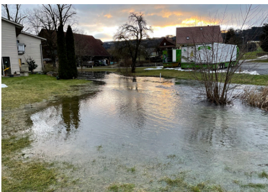
Richenseerstrasse – Richtung Linde, 31. Januar 2021

Baldeggersees von 463.60 m.ü.M. auf 464.04 m.ü.M. Bei einer Seefläche von 5.2 km 2 ergibt das eine Zunahme der Wassermenge um 2.3 Milliarden Liter. Bei den drei ehemaligen Mühlen wurden alle Wehre rechtzeitig geöffnet. Treibgut wurde regelmässig aus den Rechen, Wehren und vor Brücken entfernt. Der Gemeinderat dankt an dieser Stelle allen tatkräftigen Personen, die dafür sorgten, dass die grossen Wassermengen möglichst ohne Schaden anzurichten durch unser Dorf fliessen konnten.