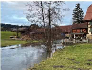
Oberhalb der oberen Mühle, 31. Januar 2021