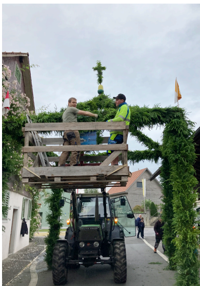
Die Helfer beim Kranzen und Aufstellen des Auffahrtsbogens