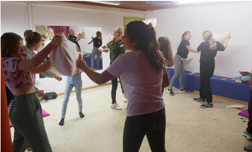
Mädchen während ihrem Wen-Do Kurs im Jugendtreff Joy

Wen-Do bedeutet «Weg der Frau» und ist seit 1972 als Gewaltpräventionskonzept speziell für weiblich gelebte Menschen entwickelt worden. Obwohl es keine Kampfsportart ist, bietet es Schutz und Raum für Betroffene durch Aneignung von stärkenden Techniken und verbal-lösungsorientierten Ansätzen. Weitere Informationen unter: https://wendo-aargau.ch/ .