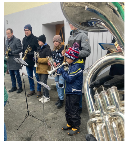
Erwachsene und Kinder spielen gemeinsam in der Brass Band Ermensee

Im Gegensatz zu vielen anderen Freizeitaktivitäten ist das Spielen eines Blasinstruments zeitlos. Beim Musizieren kann man bis ins hohe Alter aktiv Spass haben und Freude verbreiten. Alt und Jung können einfach gemeinsam musizieren.