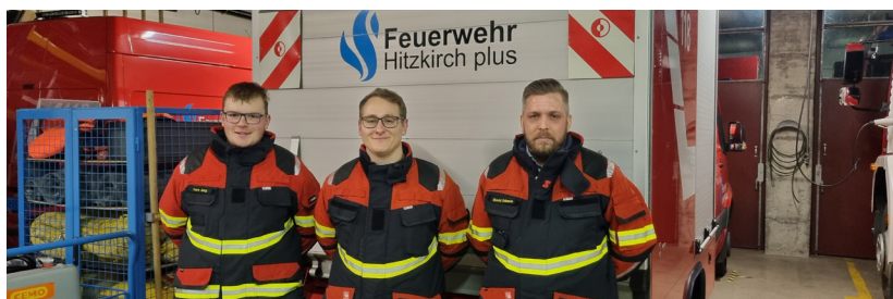
Auf dem Foto fehlen zwei AdF's aufgrund entschuldigter Absenzen

tarereignissen beschäftigt. Im zweiten Teil der Rekrutenübungen wurden die neuen Kameradinnen und Kameraden mit der persönlichen Brandschutzausrüstung ausgestattet. Die verantwortlichen Abteilungschefs haben im Anschluss eine erste Einführung in den zur Verfügung stehenden Feuerwehrfahrzeugen und dem Material durchgeführt.